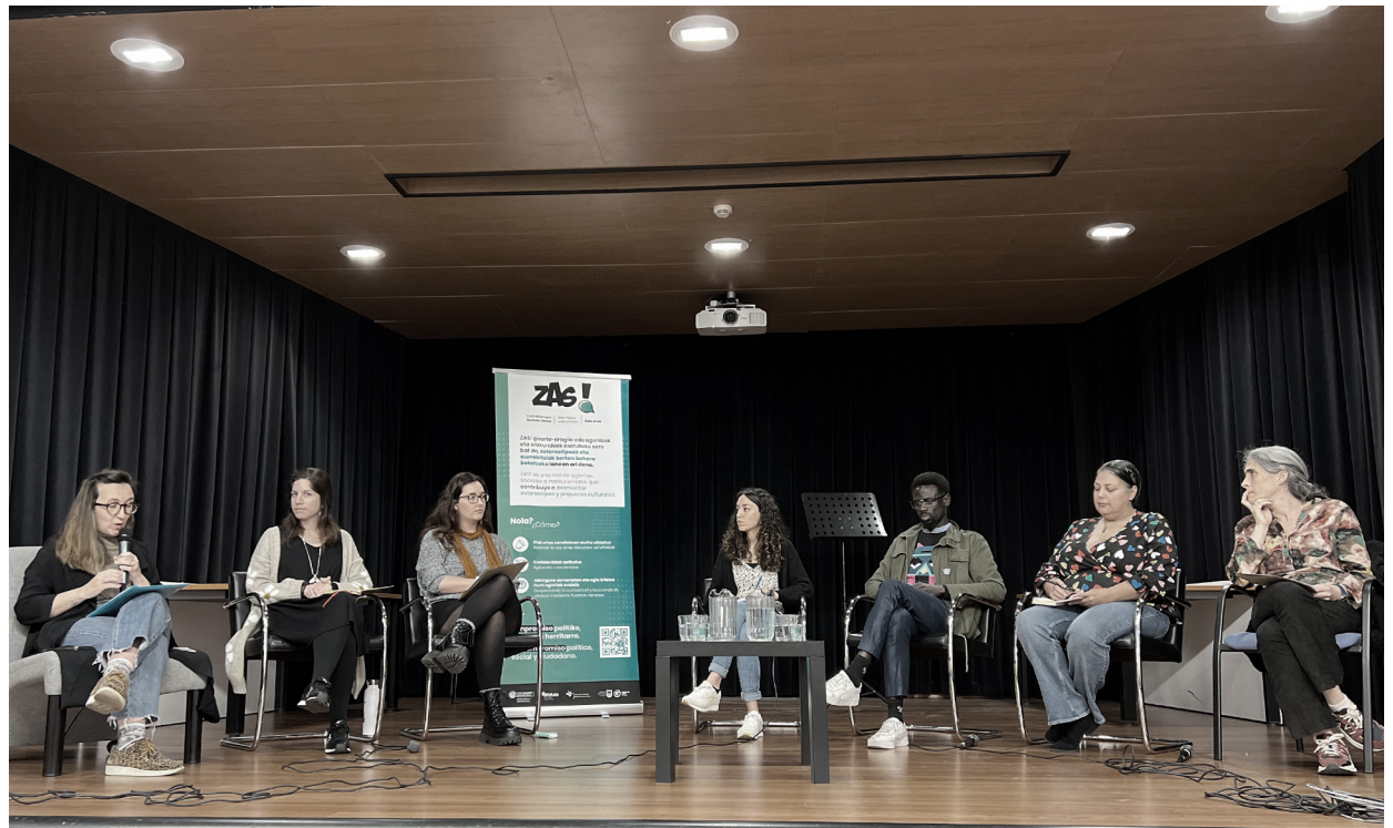
Munduko Medikuek / Médicos del Mundo | Zehar Errefuxiatuekin | AMEKADI Kooperatiba | ACEM | Matiz Elkarte / Asociación Matiz | Ellacuría Fundazioa / Fundación Ellacuría | Mujeres con Voz Elkarte / Asociación Mujeres con Voz

Alderdi saihestezinak arrazakeriaren aurkako borrokan eta zurrumurruen aurkako estrategian // Aspectos ineludibles en la lucha antirracista y en la estrategia antirumores