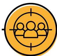
Garapen komunitarioko prozesuen ikuspegia