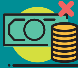
Inexistencia de políticas públicas para conciliar la vida laboral y la familiar