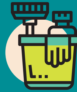
Trabajo del hogar

Hay una división internacional del TRABAJO REPRODUCTIVO .