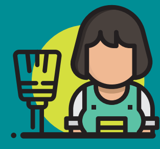
Se recurre a mano de obra extranjera femenina