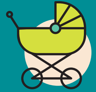
Trabajo de cuidado

En Europa la presencia de mujeres migrantes se relaciona con los cambios que ha sufrido el mapa migratorio europeo