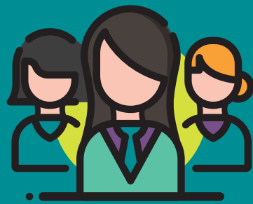
Inserción de las mujeres autóctonas en el mercado laboral

En Europa la presencia de mujeres migrantes se relaciona con los cambios que ha sufrido el mapa migratorio europeo