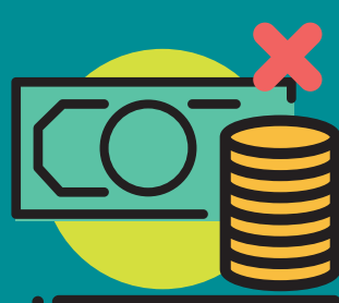
Familia eta lana bateratzeko politika publikorik eza