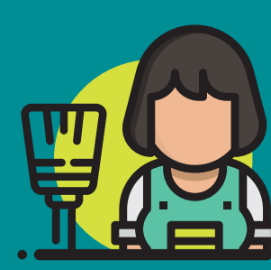
Emakume atzerritarak hartzen dira hemen lan egiteko